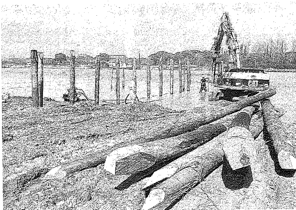
COLLEGAMENTO L'approdo in costruzione a Bibione sulla foce del fiume Tagliamento